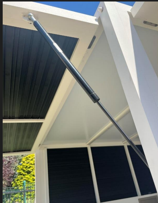
Système d'ouverture et de fermeture avec vérins nautique testé en brouillard salin