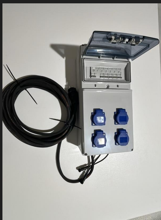
Tableau électrique étanche avec prises, équipé d'une alimentation électrique de 10 mètres. Puissance 40 A