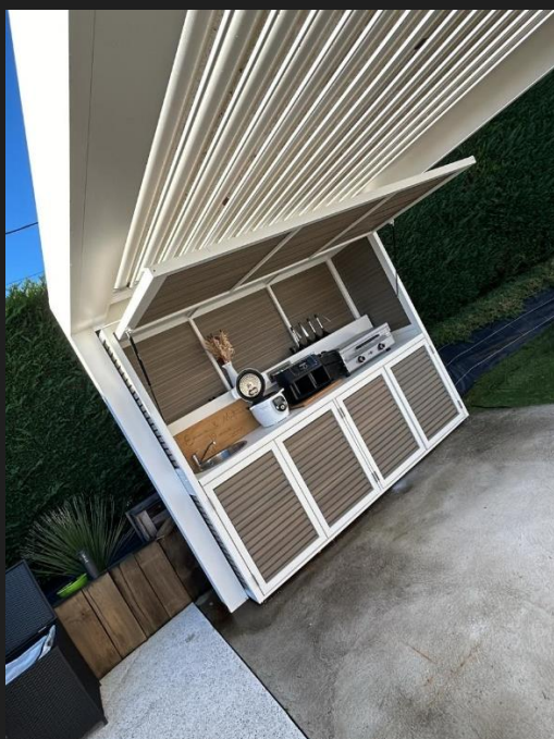
4 Portes battantes et 1 volet en aluminium et bardage composite (ou 1 seul volet pergola avec portes coulissantes intégrées)