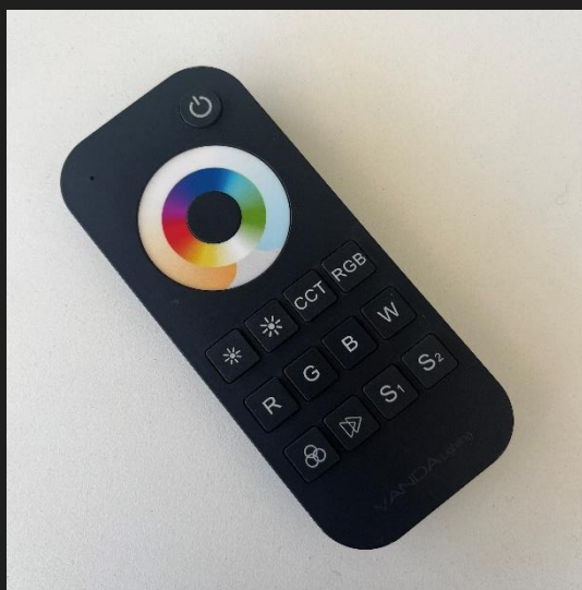
Eclairage LED RGBW avec sa télécommande