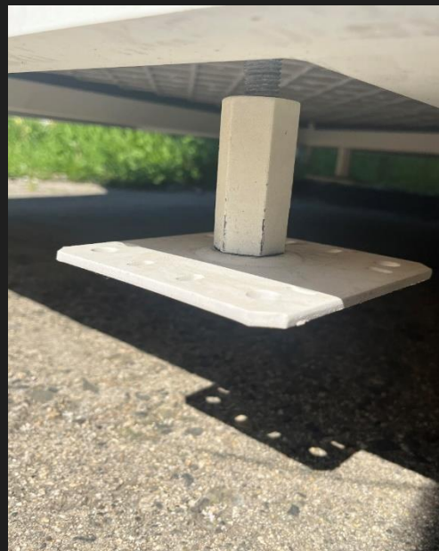
Pieds réglables jusqu'à 45mm. Entre le sol et le bas de la structure se trouve un vide sanitaire de 55mm, ensuite se trouve l'amplitude de réglage pouvant aller jusqu'à 45mm, le mini entre le sol et la structure est de 55mm et le maximum avec le réglage des pieds est de 100mm.