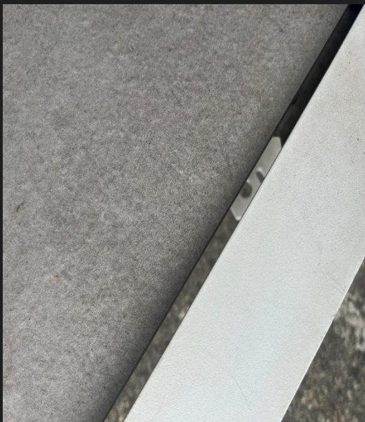
Dalles grès cérame 2cm livrables Avec 2 coloris au choix