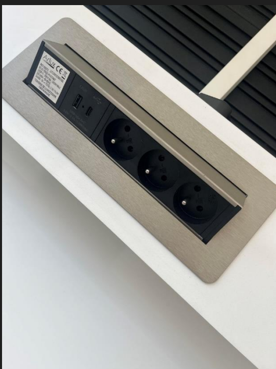
Au niveau du plan de travail, bénéficiez de 3 prises, avec 1 USB et 1 USB C