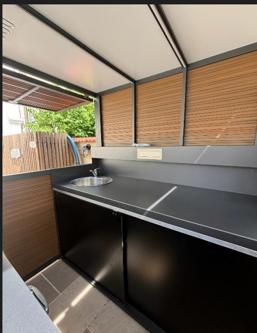
2 portes coulissantes en FOAMLITE (2 coloris disponibles)